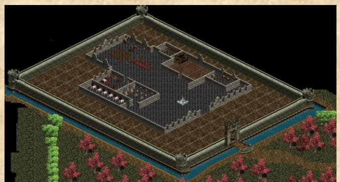
Das Schloss des Lichts für den nächsten Content