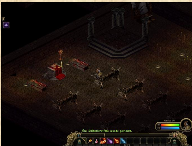
Puhh ist das Düster im neuen Dunklen Tempel Lichthafens.