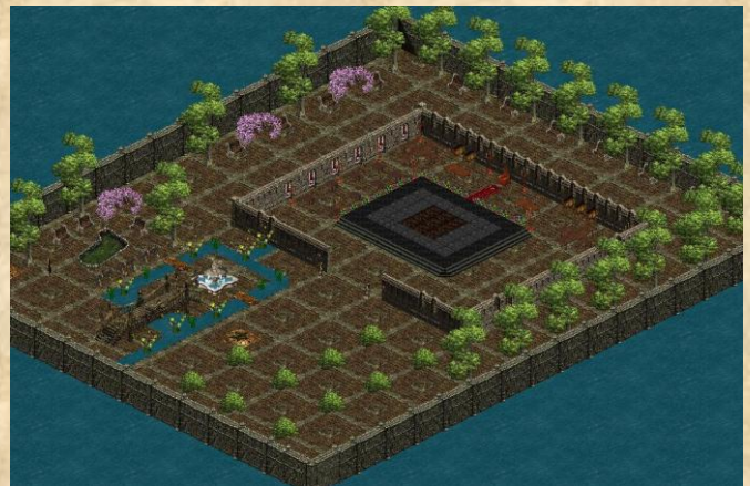
Der neue Ballsaal