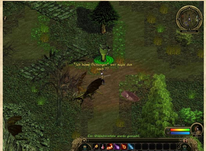
*Ich hasse Schlangen*