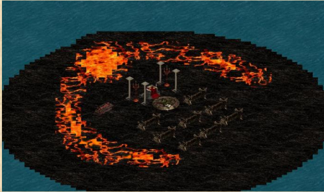
Eventinsel für die Anhänger Ogrimar's