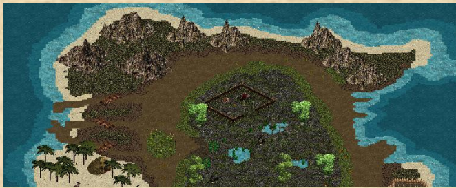
Kleiner Ausschnitt vom neuen Sumpfgbiet